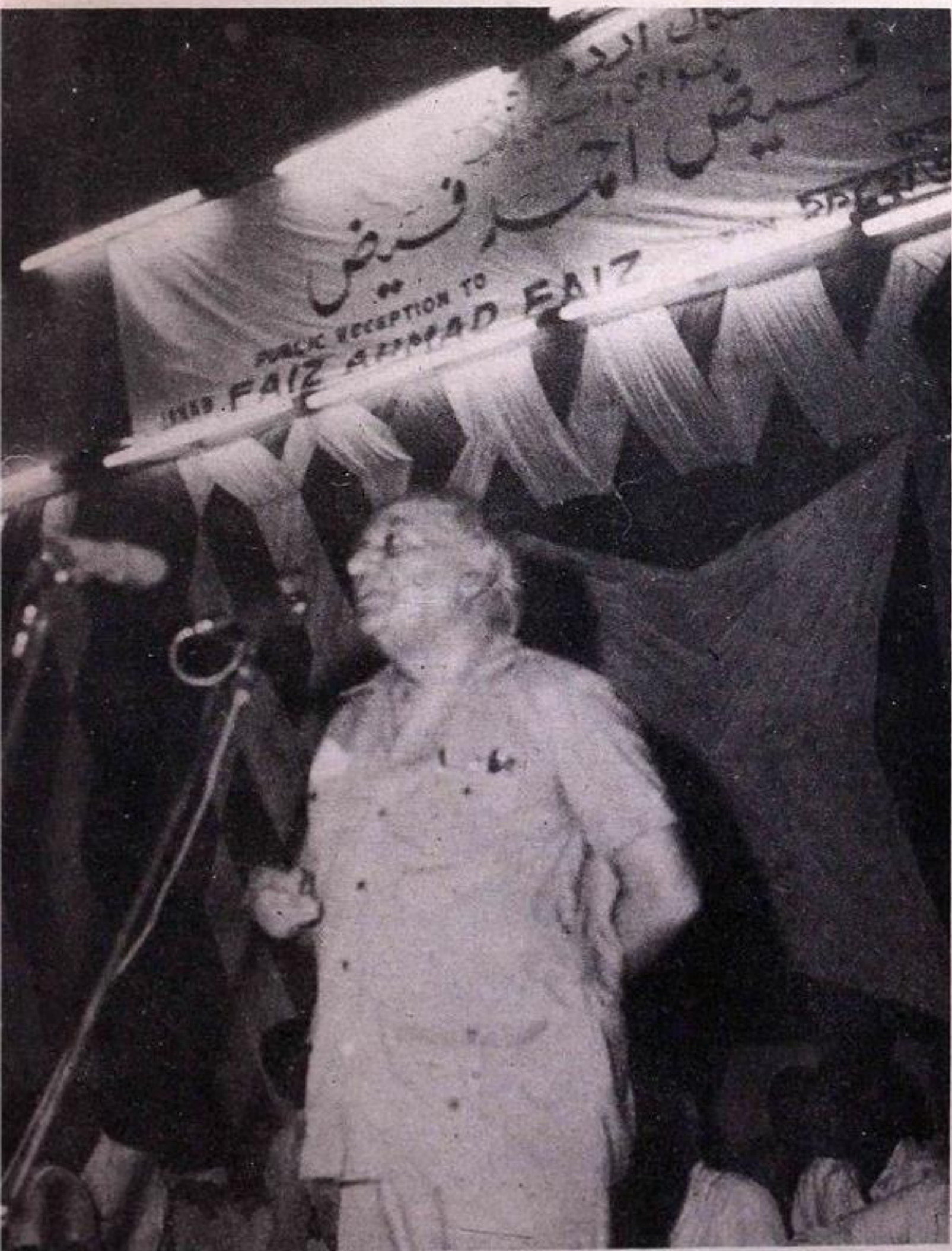
فیض سامعین سے خطاب کرتے ہوئے۔